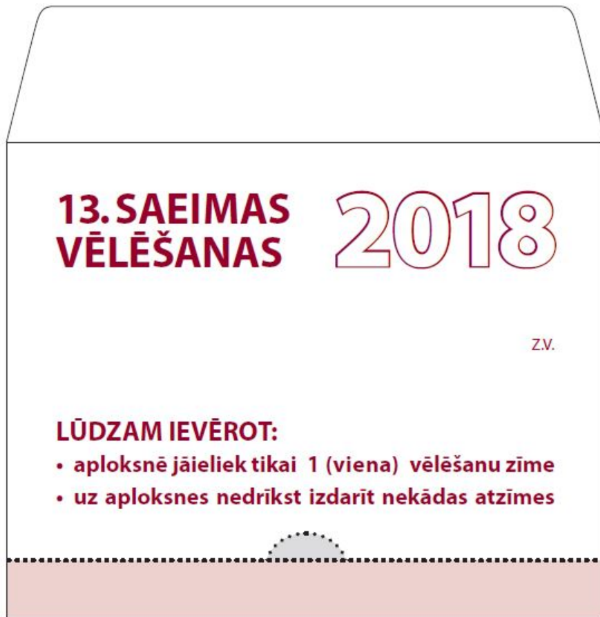
1.attēls 13.Saeimas vēlēšanu aploksnis, priekšpuse